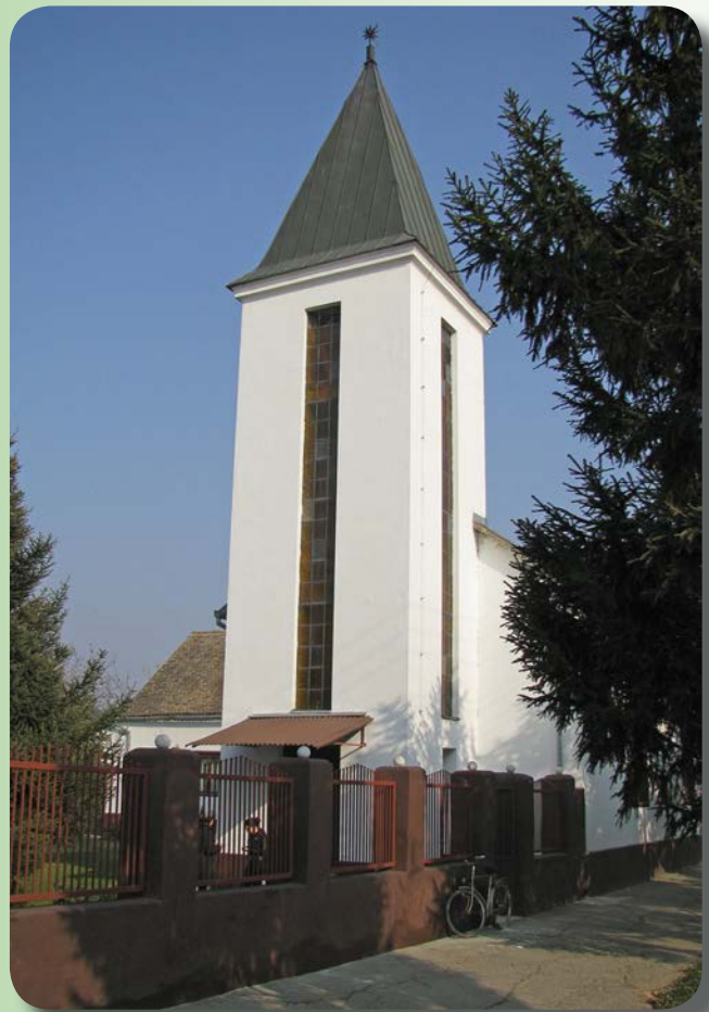
Állandó lelkészre vár a Maradéki gyülekezet